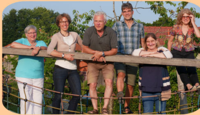
Gründungsmitglieder des Vereins