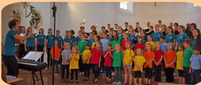
Jakobus-Spatzen, Jugendchor und Jakobuschor miteinander im Konzert