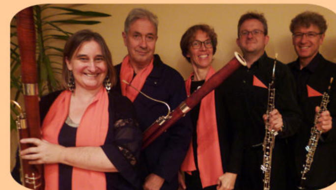
Besondere Kammerkonzerte mit dem Fagott-Ensemble Deep Double Reed Players