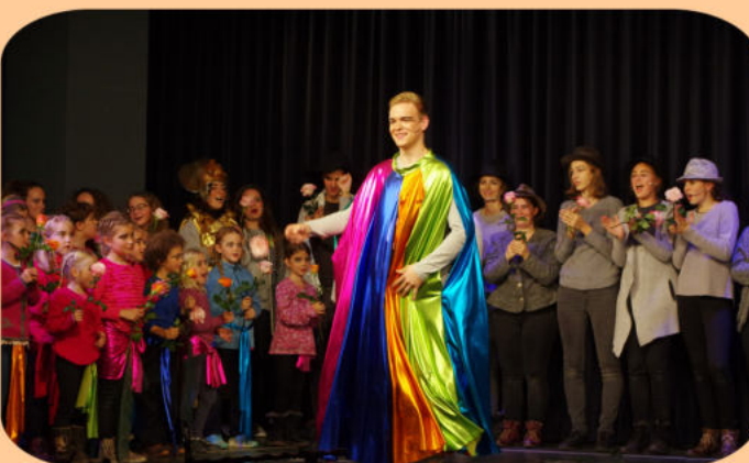
Musical Joseph in Bad Endorf und Vorarlberg