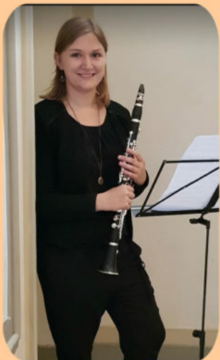
Kulturförder- preisträgerin des Landkreises Rosenheim