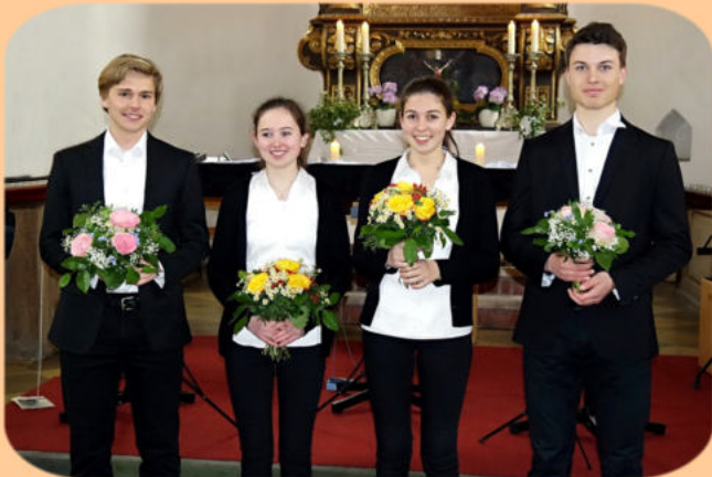
Jugend Musiziert PreisträgerInnen

Jährlicher Mitgliedsbeitrag mind. 20.- € Schüler und Studenten 10.- €