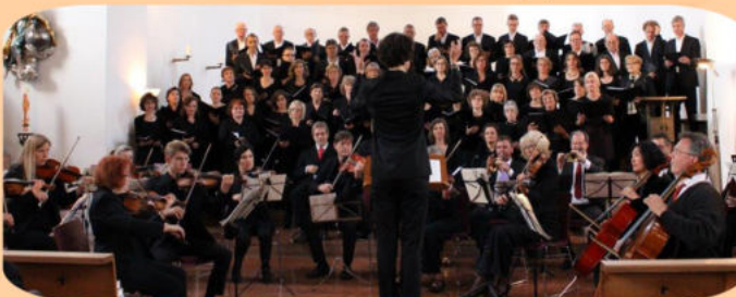
Chor-Solisten-Orchesterkonzerte bei den Bad Endorfer Orgelwochen