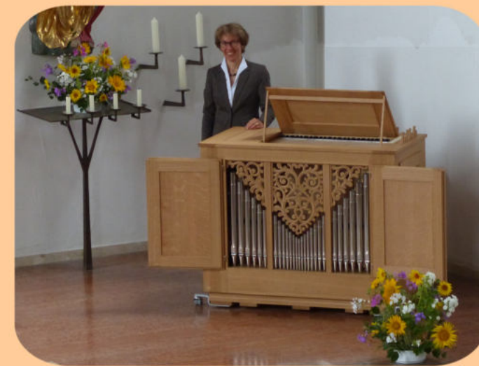
neue Truhengorgel Bad Endorf von Willi Osterhammer